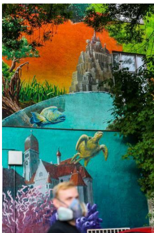
GRENZEN (2015) Frederic Sonntag