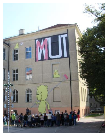
MUT (2016) BRNZN