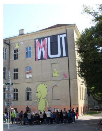
MUT (2016) BRNZN