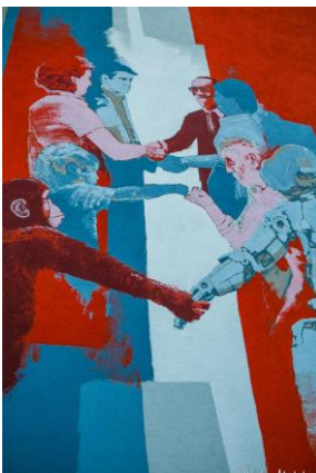
UTOPIE (2018) Guido Zimmermann