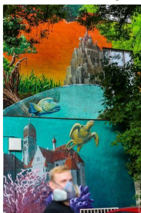
GRENZEN (2015) Frederic Sonntag